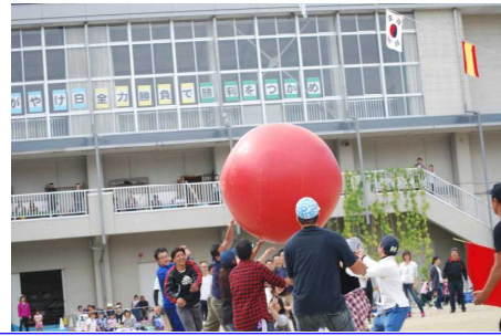
子どもたちにも負けていません。PTA 種目の大玉送り 迫力満点。多くの保護者の皆さんのご参加に感謝です