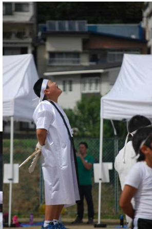
【応援団】 応援団長をリーダーに全力 応援が素晴らしかった。