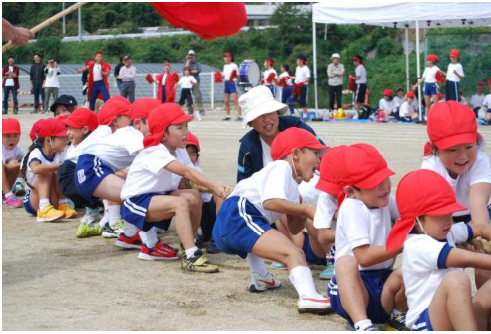
綱引き 見ている方も思わず力が入ります