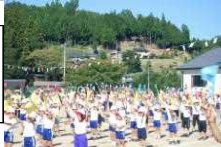
下條の運動会恒例の下 條マーチは、最後みんな 疲れている中でも、 がんばってビシッと演 技できました。

保護者の皆さまからの運動会アンケートにもたくさん職員が励みになるご感想をいただきました。子ども達の成長のために熱心に力を入れて取り組んできた者にはうれしい限りです。大変ありがとうございました。