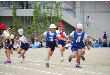
選抜リレーも迫力 でした。補欠のお子さん も一緒に朝早くからの 練習にがんばってきま した。本番もトラック のコーナーで選手のサ ポート係としてがんば ってくれていました。