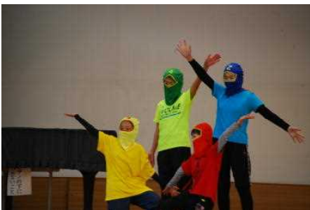
あいさつ戦隊『笑顔レンジャー』登場

明日から冬休みになりますが、長期休業だからじっくり読めるような本に挑戦するなどゲームやインターネットから離れて、1日5分でも読書の習慣を続けていきましょう。