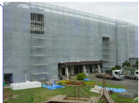
【H29大規模改修の様子から】

土日やお盆休みなしで工事を進めても夏休み明けにはまだ工事は完了しません。暑い中、頑張って工事をしてくださる工事の方々には感謝したいと思います。