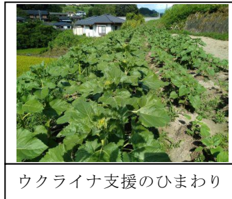
ウクライナ支援のひまわり